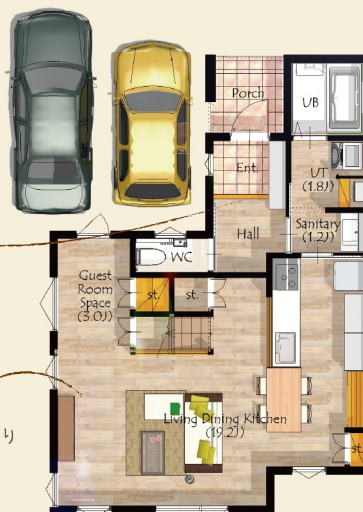
— 1F平面図 —